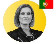
Rita Carles Fon Yöneticisi